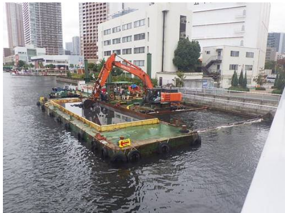
しゅんせつ工（土運船積込） 平成30年12月