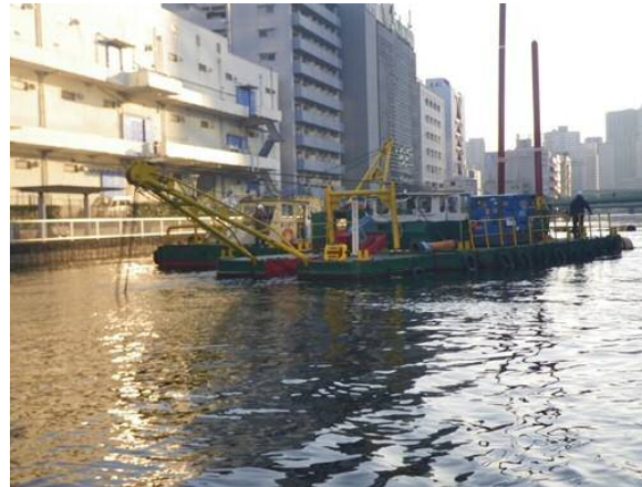
しゅんせつ工（バックホウ浚渫船） 平成31年1月