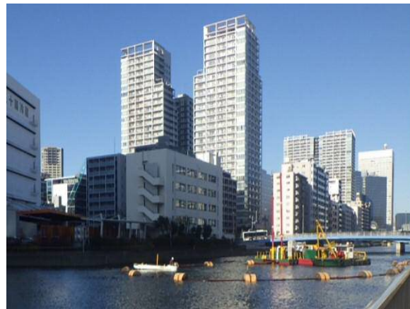
しゅんせつ工（排砂管状況） 平成31年1月