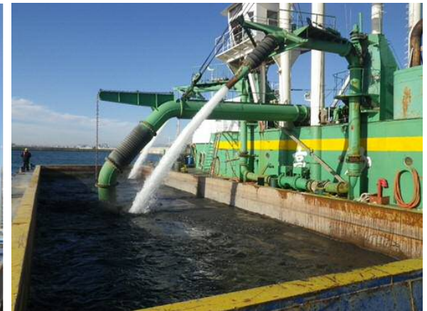
揚土送泥（新海面処分場） 平成30年12月