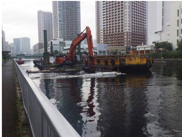
しゅんせつ工（バックホウ浚渫船） 平成30年12月