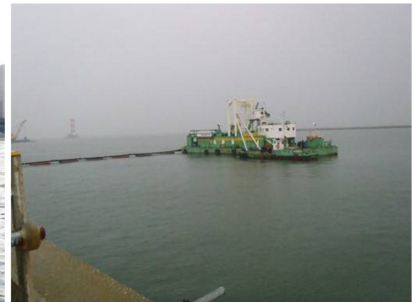
揚土送泥（新海面処分場） 平成30年12月